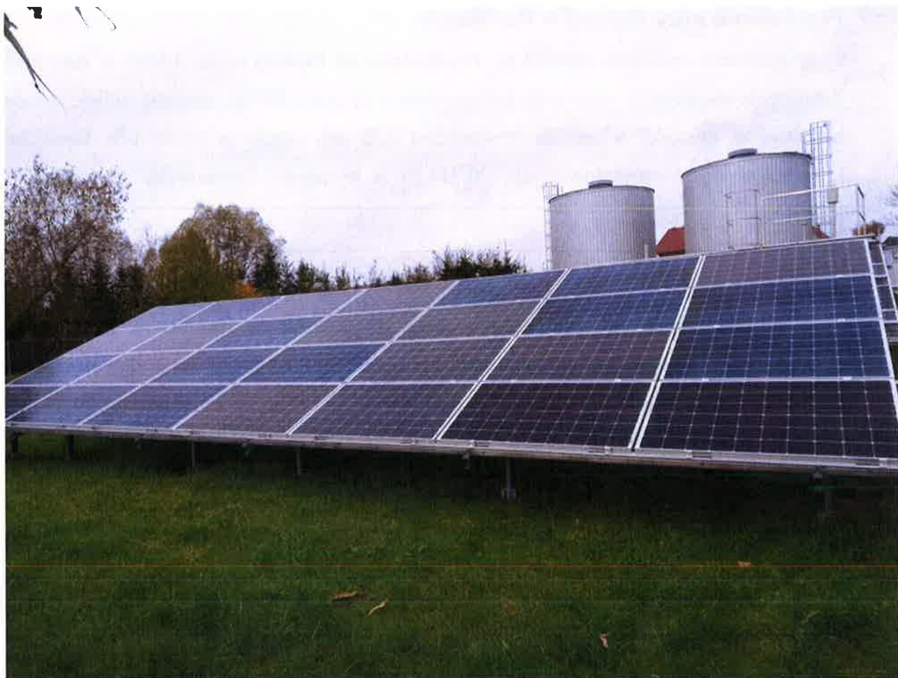
Zdjęcie 8. Instalacja fotowoltaiczna – Stacja uzdatniania wody w Radziłowie.

Gmina Radziłów otrzymała wsparcie ze środków Unii Europejskiej w ramach Regionalnego Programu Operacyjnego Województwa Podlaskiego na lata 2014 – 2020 na zadanie pn. Budowa instalacji fotowoltaicznych na potrzeby własne obiektów gminnych w Gminie Radziłów.