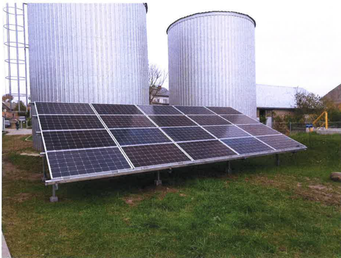
Zdjęcie 7. Instalacja fotowoltaiczna – Stacja uzdatniania wody w Radziłowie.