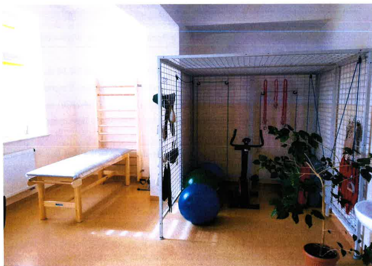
Zdjęcie 12. Dom Pomocy Społecznej w Mścichach – sala rehabilitacyjna.