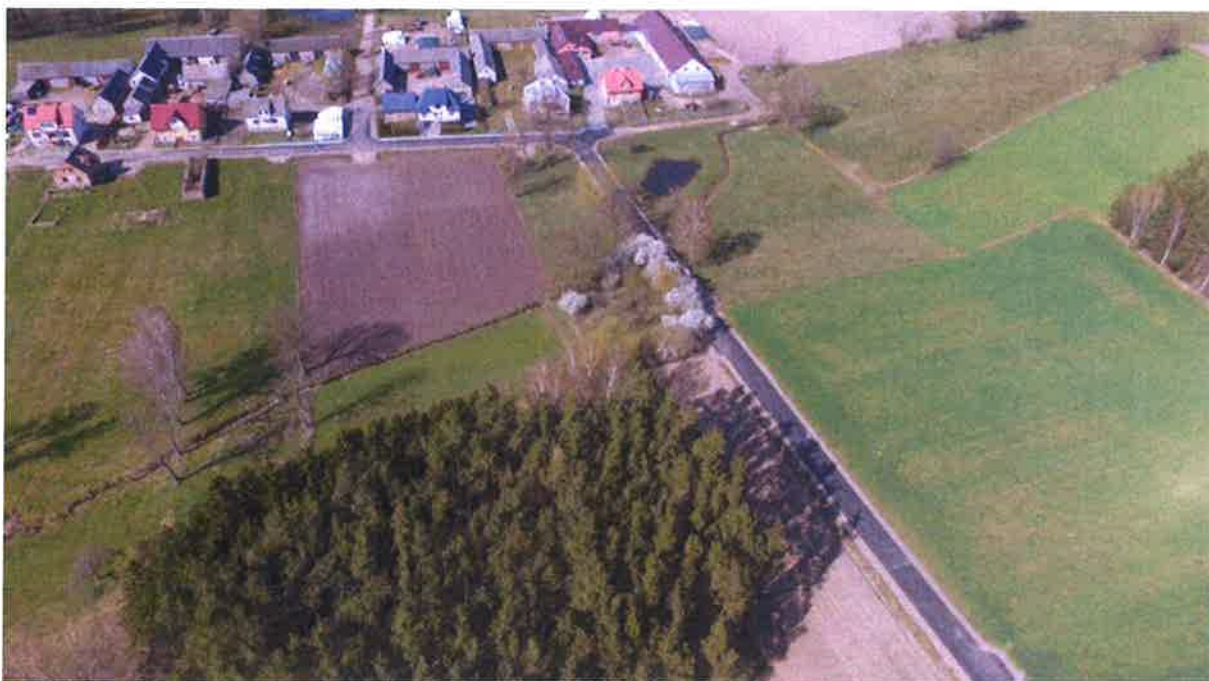
Zdjęcie 3. Droga gminna nr 104154B od drogi powiatowej Nr 1836B w msc. Szyjki.