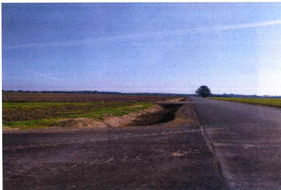
Zdjęcie 6. Droga gminna nr 104139B od msc. Zakrzewo w km 0+303-0+997