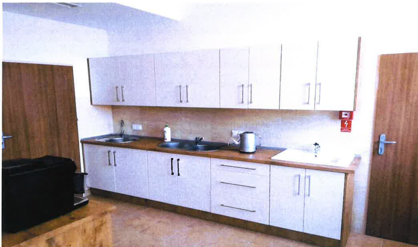
Zdjęcie 13. Dom Pomocy Społecznej w Mścichach - kuchnia.