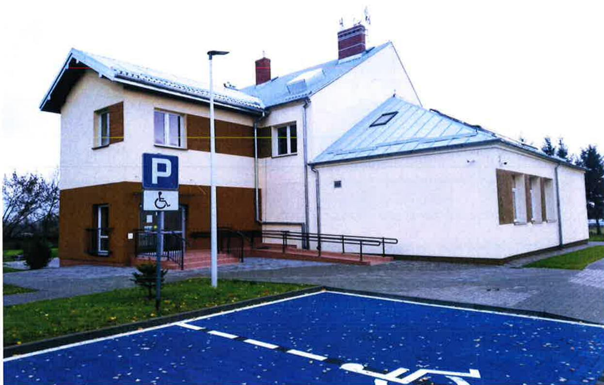
Zdjęcie 11. Dom Pomocy Społecznej w Mścichach.