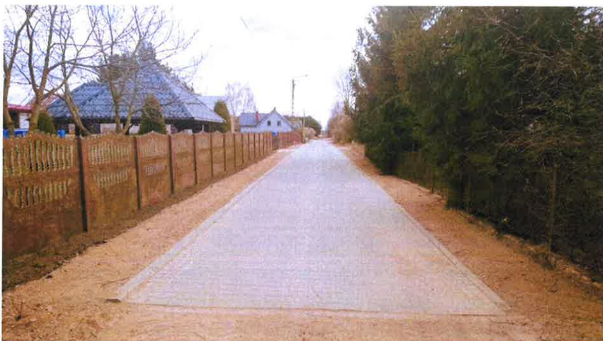
Zdjęcie 4. Droga gminna nr 162709B w msc. Klimaszewnica.