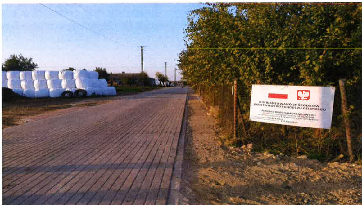
Zdjęcie 5. Drogi gminna nr 162524B w msc. Karwowo.