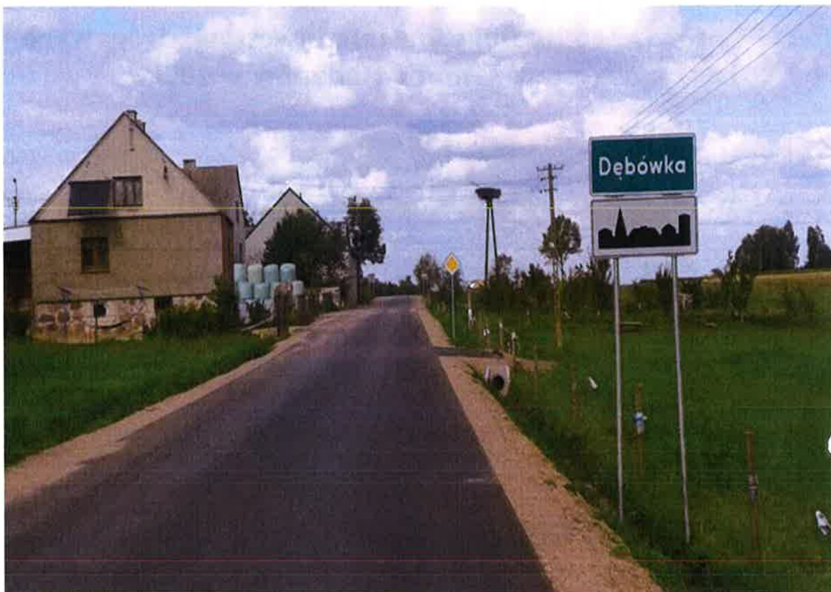
Zdjęcie 1. Droga gminna nr 104150B Radziłów – Dębówka