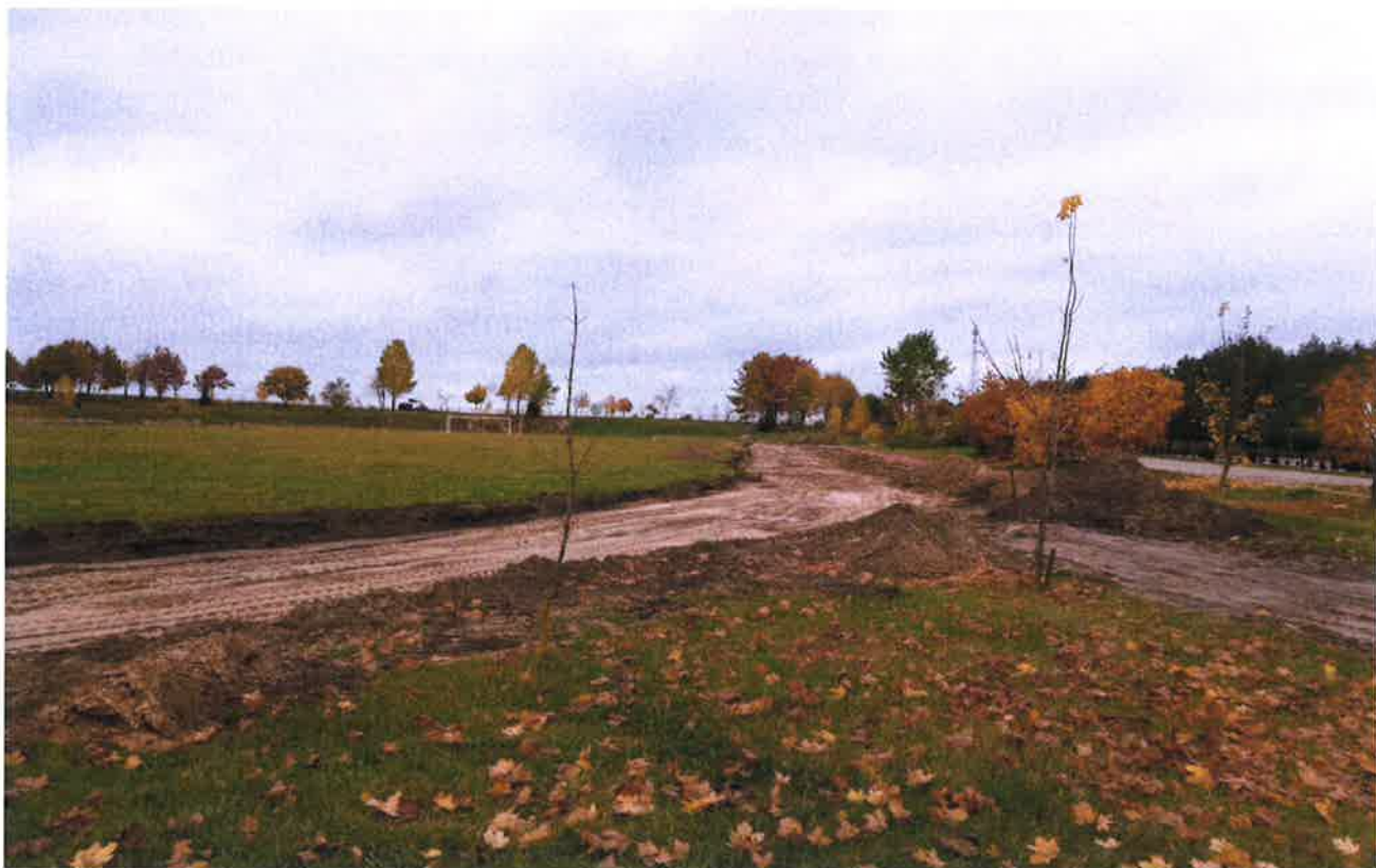
Zdjęcie 9. Bieżnia w Radziłowie w trakcie przebudowy.

Inwestycja pn. Przebudowa bieżni okrężnej 4-torowej o długości 400 metrów w Radziłowie dofinansowana została ze środków Funduszu Rozwoju Kultury Fizycznej w ramach programu Sportowa Polska – Program Rozwoju Lokalnej Infrastruktury Sportowej – Edycja 2019.