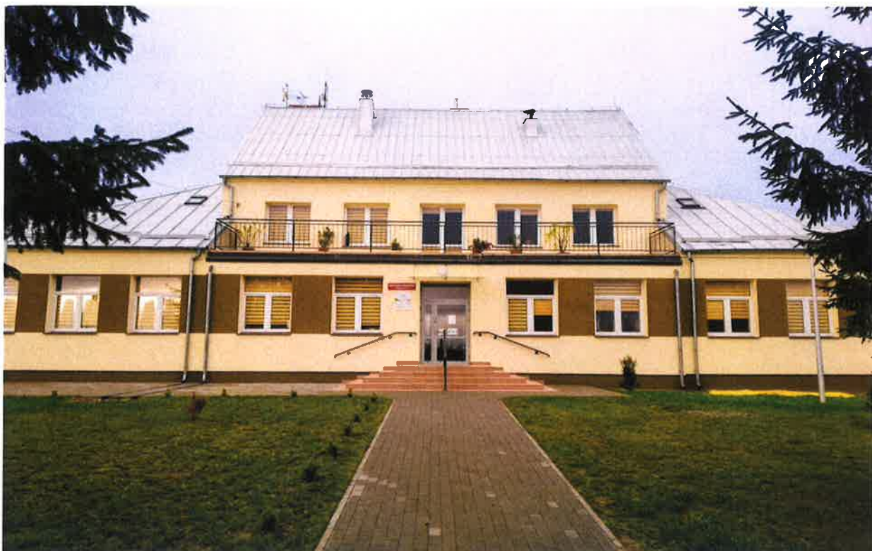
Zdjęcie 10. Dom Pomocy Społecznej w Mścichach.

Całkowita wartość inwestycji to 2 227 252,68 zł , z czego Gmina Radziłów otrzymała następujące dofinansowania na realizację zadania: