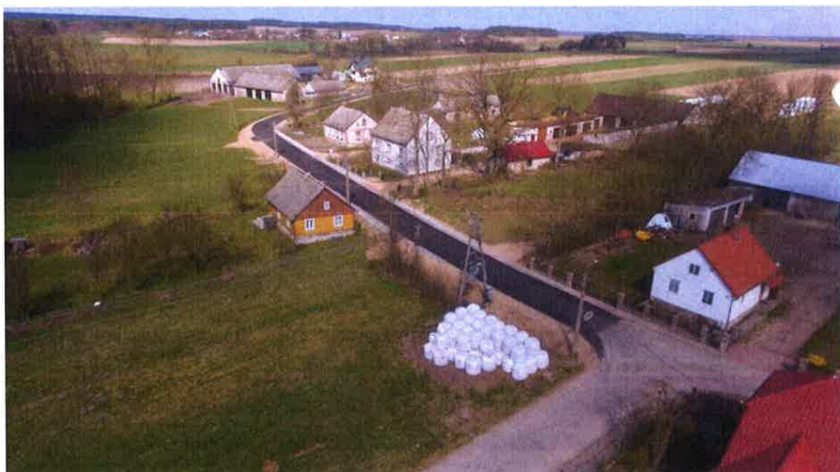
Zdjęcie 2. Droga gminna w msc. Konopki Awissa.