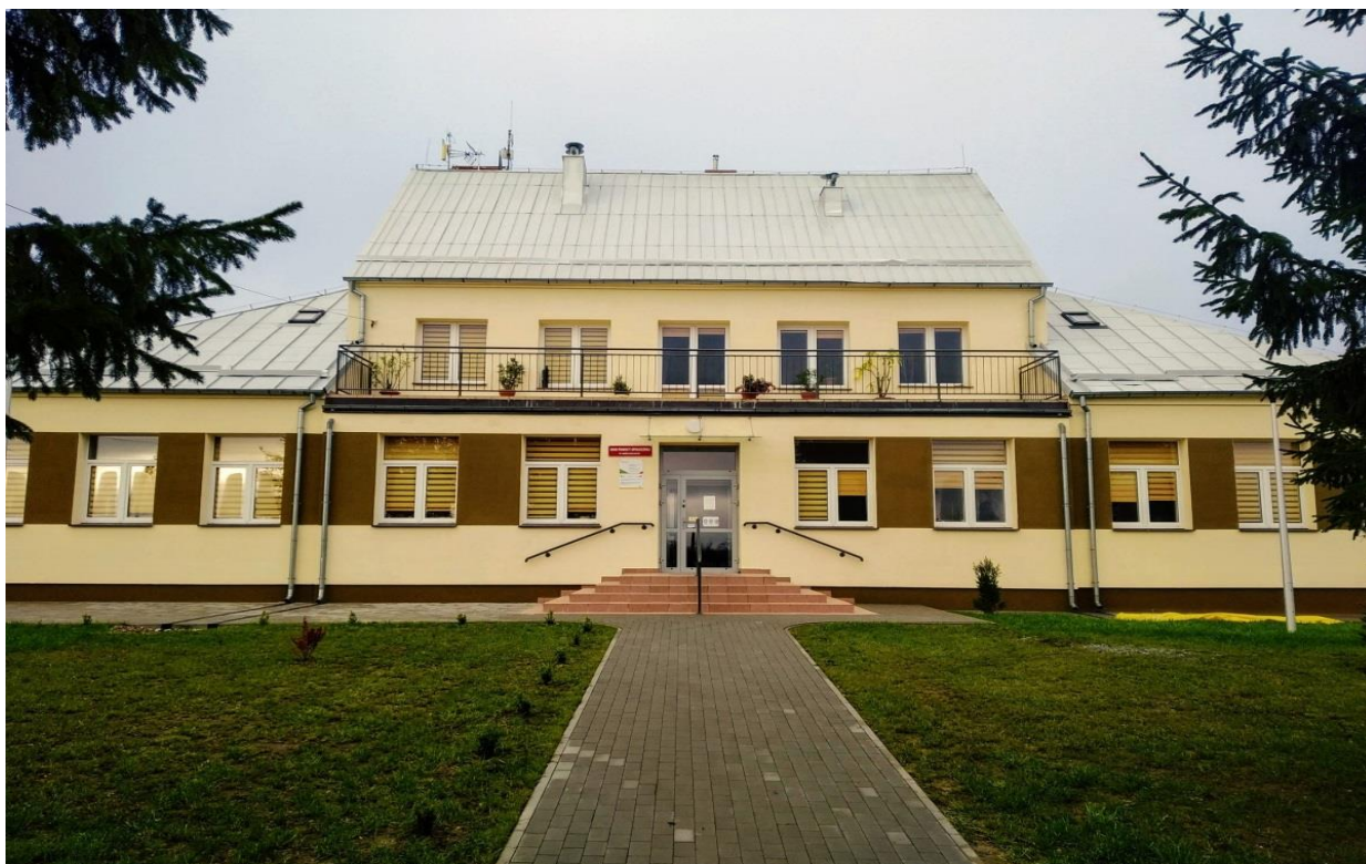
Zdjęcie 10. Dom Pomocy Społecznej w Mścichach.

Całkowita wartość inwestycji to 2 227 252,68 zł , z czego Gmina Radziłów otrzymała następujące dofinansowania na realizację zadania: