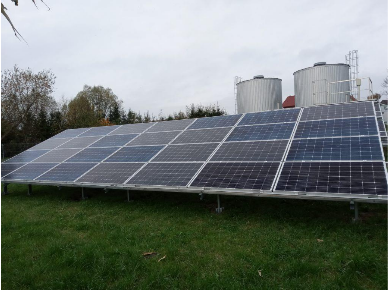
Zdjęcie 8. Instalacja fotowoltaiczna – Stacja uzdatniania wody w Radziłowie.

Gmina Radziłów otrzymała wsparcie ze środków Unii Europejskiej w ramach Regionalnego Programu Operacyjnego Województwa Podlaskiego na lata 2014 – 2020 na zadanie pn. Budowa instalacji fotowoltaicznych na potrzeby własne obiektów gminnych w Gminie Radziłów.