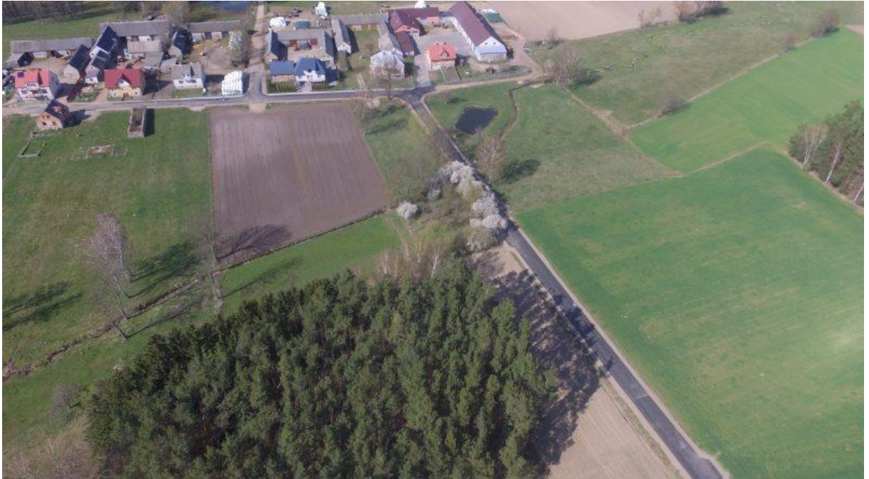
Zdjęcie 3. Droga gminna nr 104154B od drogi powiatowej Nr 1836B w msc. Szyjki.