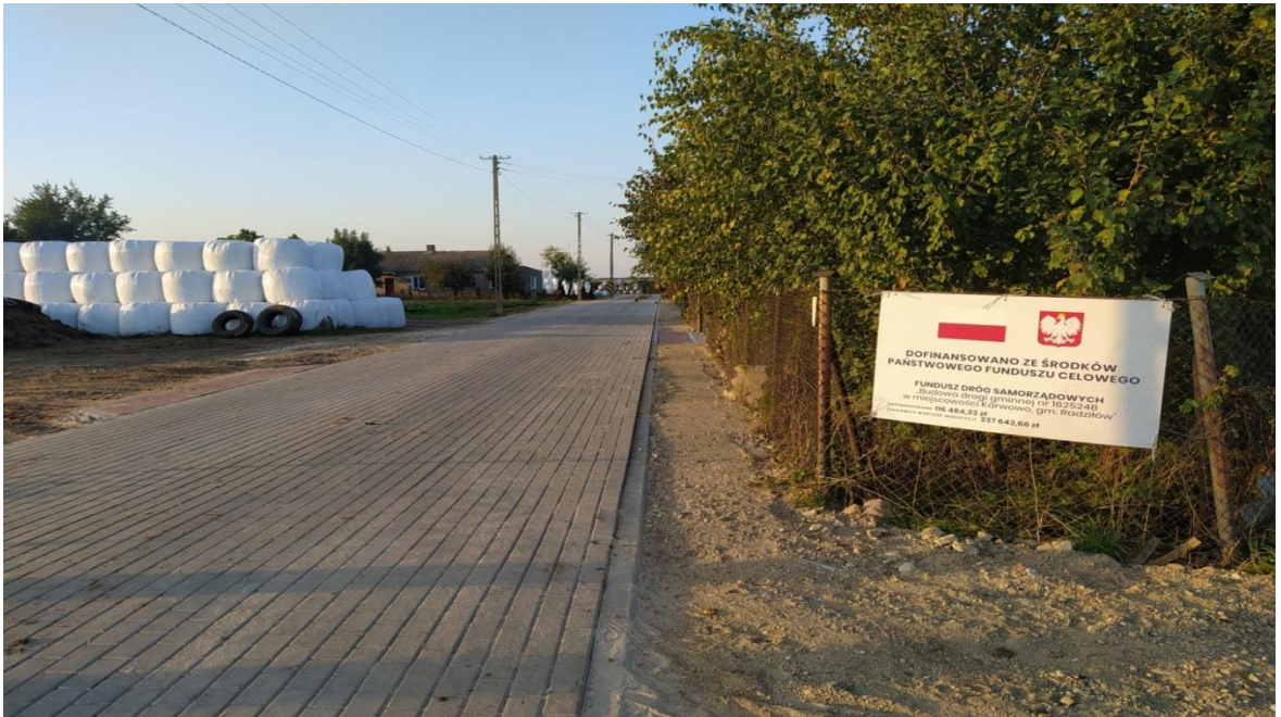
Zdjęcie 5. Drogi gminna nr 162524B w msc. Karwowo.