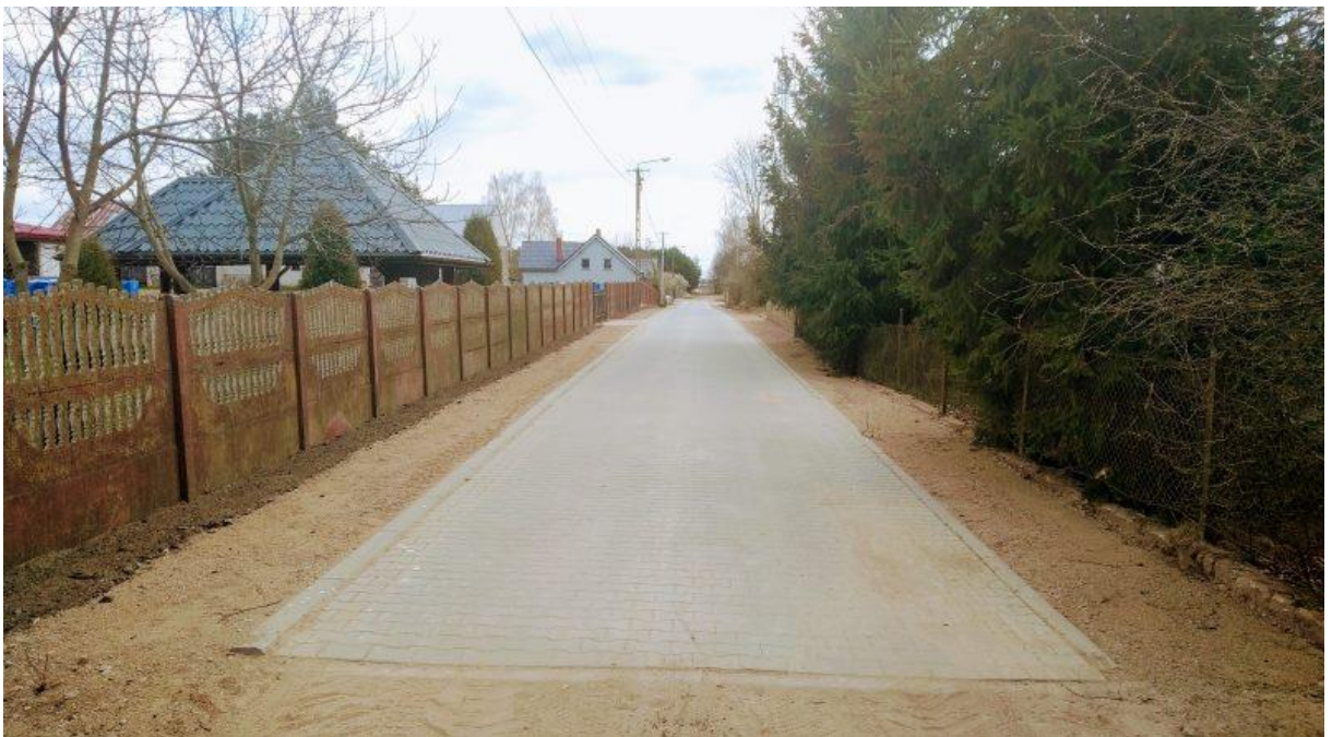
Zdjęcie 4. Droga gminna nr 162709B w msc. Klimaszewnica.