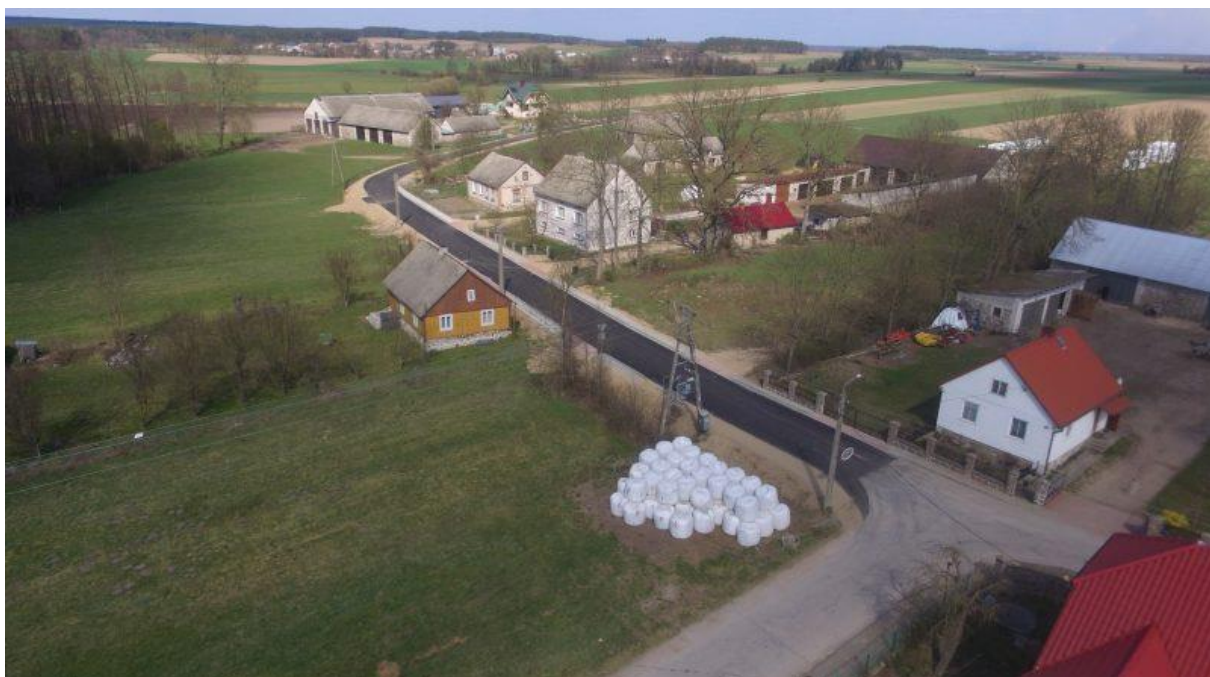
Zdjęcie 2. Droga gminna w msc. Konopki Awissa.