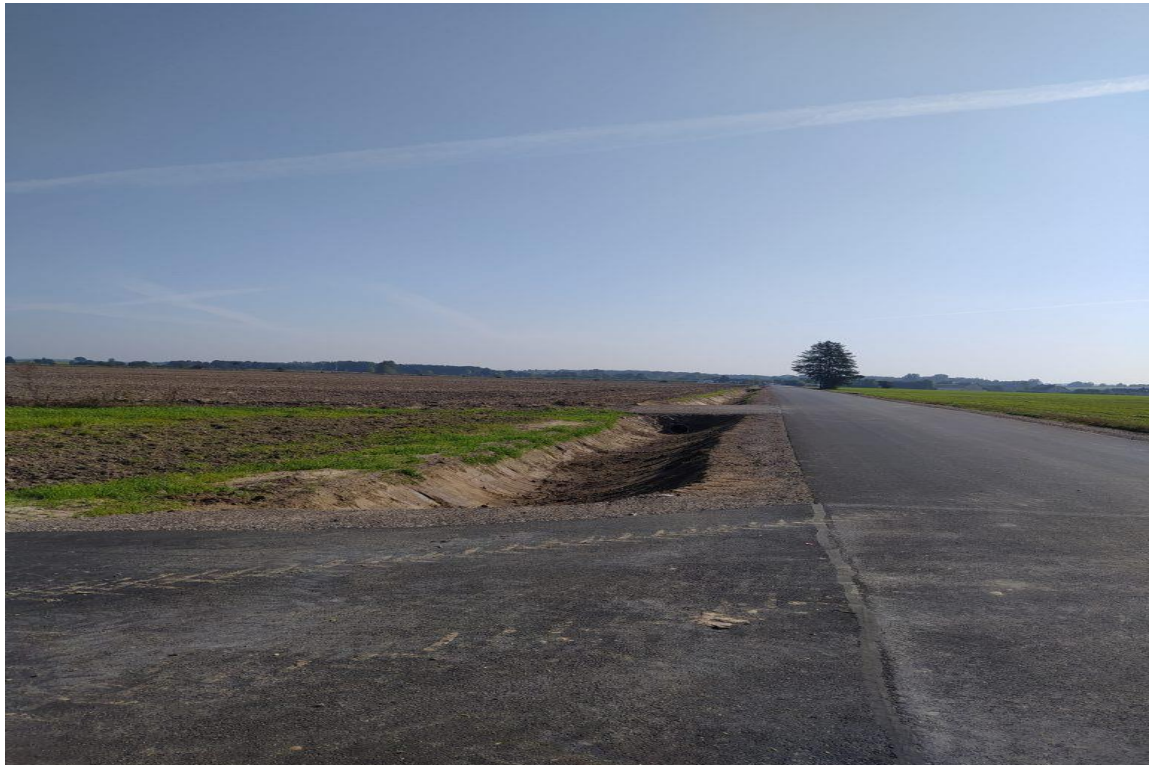
Zdjęcie 6. Droga gminna nr 104139B od msc. Zakrzewo w km 0+303-0+997