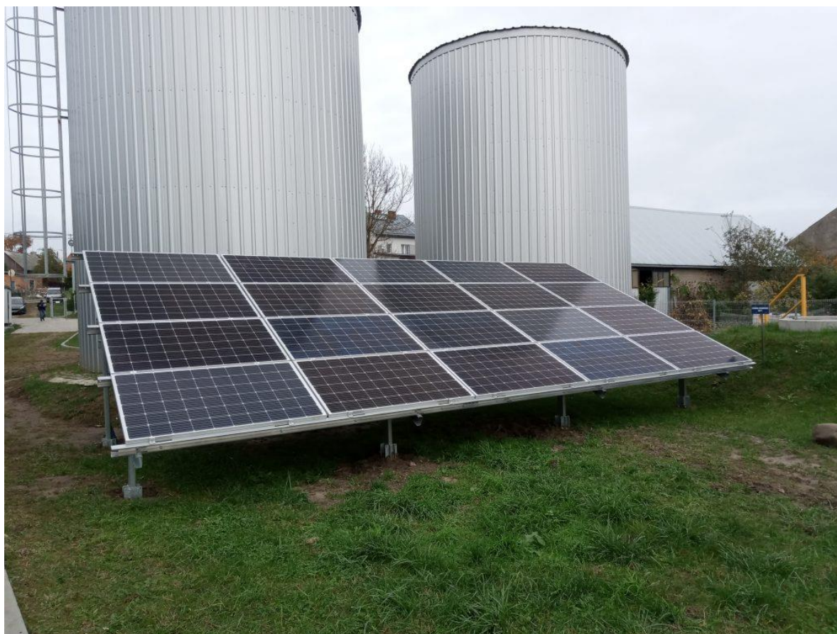
Zdjęcie 7. Instalacja fotowoltaiczna – Stacja uzdatniania wody w Radziłowie.