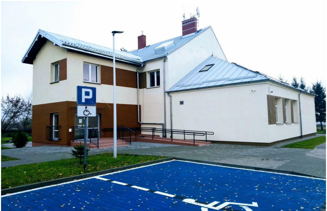
Zdjęcie 11. Dom Pomocy Społecznej w Mścichach.