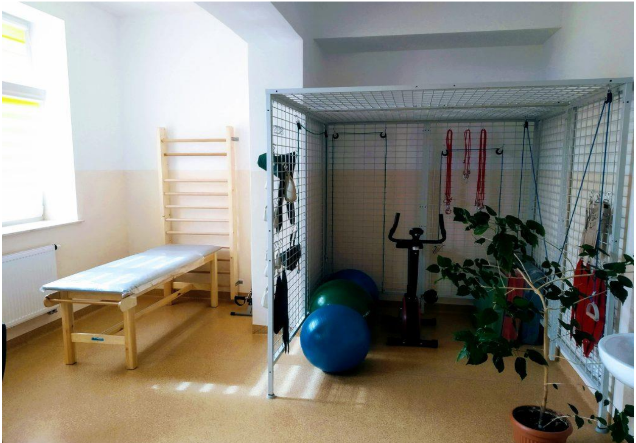
Zdjęcie 12. Dom Pomocy Społecznej w Mścichach – sala rehabilitacyjna.