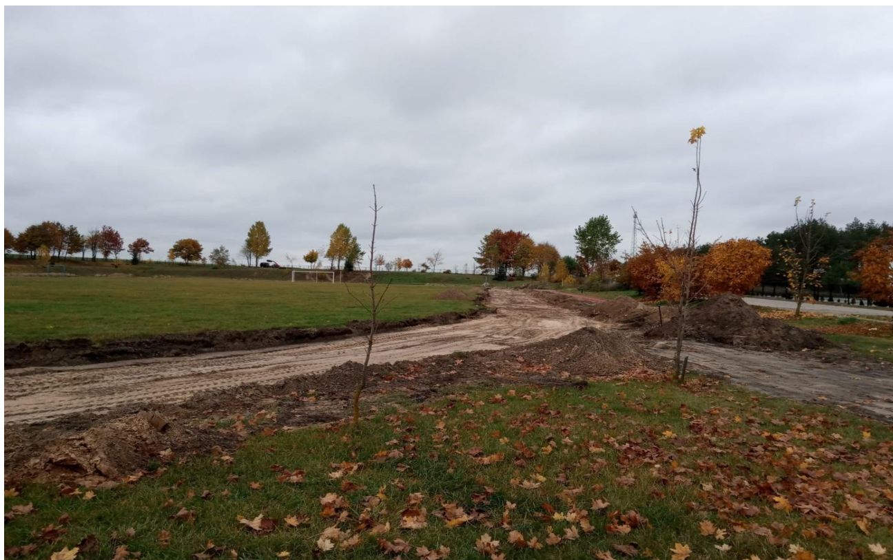
Zdjęcie 9. Bieżnia w Radziłowie w trakcie przebudowy.

Inwestycja pn. Przebudowa bieżni okrężnej 4-torowej o długości 400 metrów w Radziłowie dofinansowana została ze środków Funduszu Rozwoju Kultury Fizycznej w ramach programu Sportowa Polska – Program Rozwoju Lokalnej Infrastruktury Sportowej – Edycja 2019.