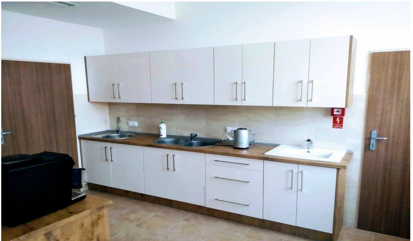
Zdjęcie 13. Dom Pomocy Społecznej w Mścichach - kuchnia.