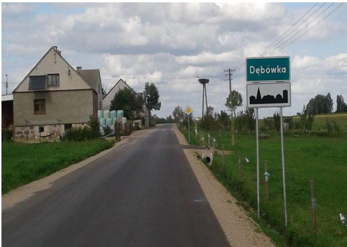
Zdjęcie 1. Droga gminna nr 104150B Radziłów – Dębówka