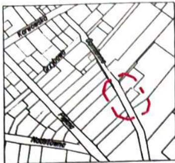
Szkic orientacyjny Skala 1:5000