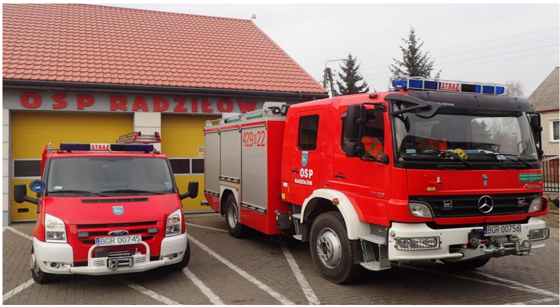
Zdjęcie 13. Samochody ratowniczo – gaśnicze OSP Radziłów

Ochotnicza Straż Pożarna w Radziłowie w 2023 r. została zadysponowana do 38 interwencji: