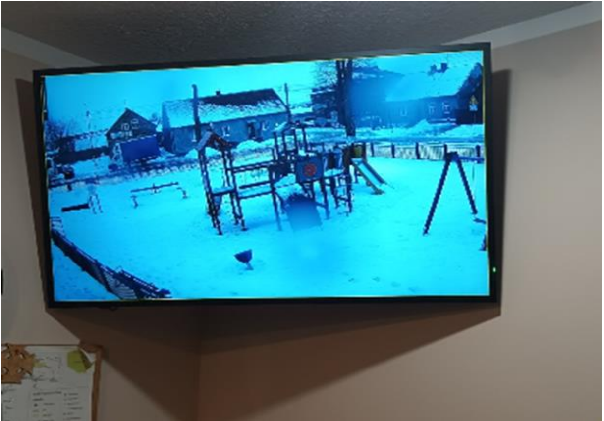
Zdjęcie 5. Obraz z monitoringu parku w Radzilowie