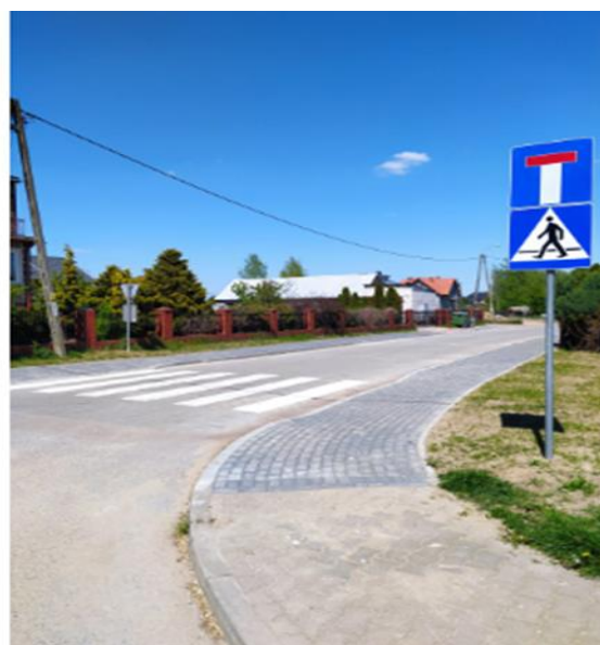
Zdjęcie 1. Ulica Sadowa w msc. Radziłów