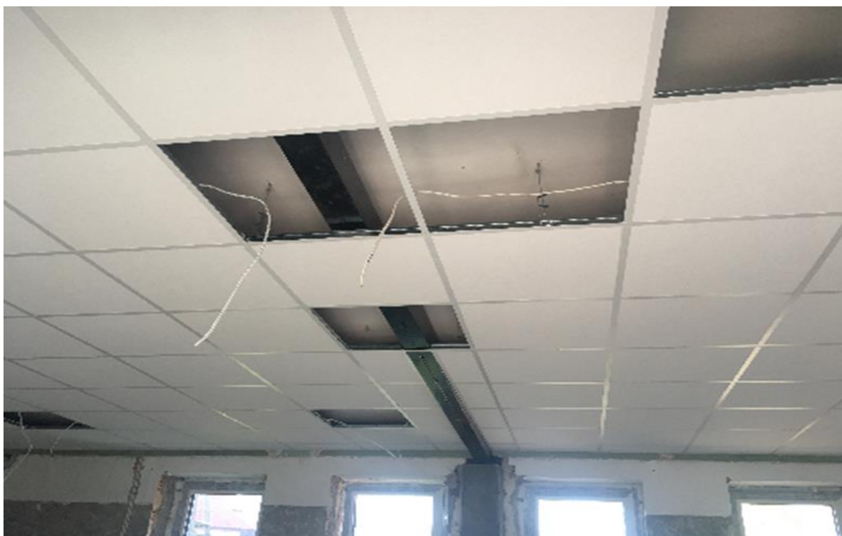
Zdjęcie 9. Sufit w świetlicy w msc. Łoje - Awissa

Dnia 31 października 2023 r., zakończyły się kolejne prace remontowe w budynku świetlicy wiejskiej w Łojach Awissa; w tym dniu dokonano odbioru prac związanych z wykonaniem podwieszanego sufitu kasetonowego o powierzchni 75,53 m 2 . Wykonawcą prac był Zakład Remontowo – Budowlany z siedzibą przy ul. Królowej Bony 2, 18-400 Łomża. Koszt przeprowadzonego remontu wyniósł 12 422,42 zł. Środki finansowe pochodziły z budżetu Gminy Radziłów. Dzięki tej inwestycji poprawiła się estetyka wnętrza budynku.