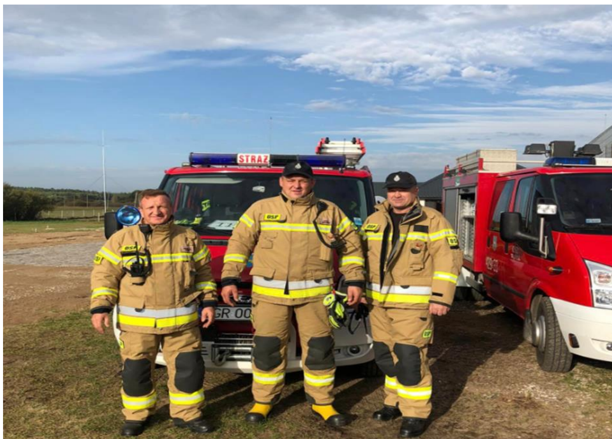
Zdjęcie 16. Strażacy OSP Radziłów uczestniczący w I Warsztatach Ratownictwa Medycznego

W październiku 2023 r. druhowie OSP Radziłów uczestniczyli w I Warsztatach Ratownictwa Medycznego Powiatu Grajewskiego, w których zdobyli 3 miejsce na 11 zespołów startujących z jednostek KSRG OSP z terenu powiatu grajewskiego.