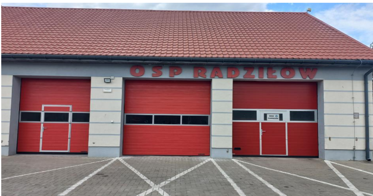
Zdjęcie 14. Wymiana bramy garażowej w OSP Radziłów.

Za w/w środki została wymieniona brama garażowa kwota - 10 500,00 zł.