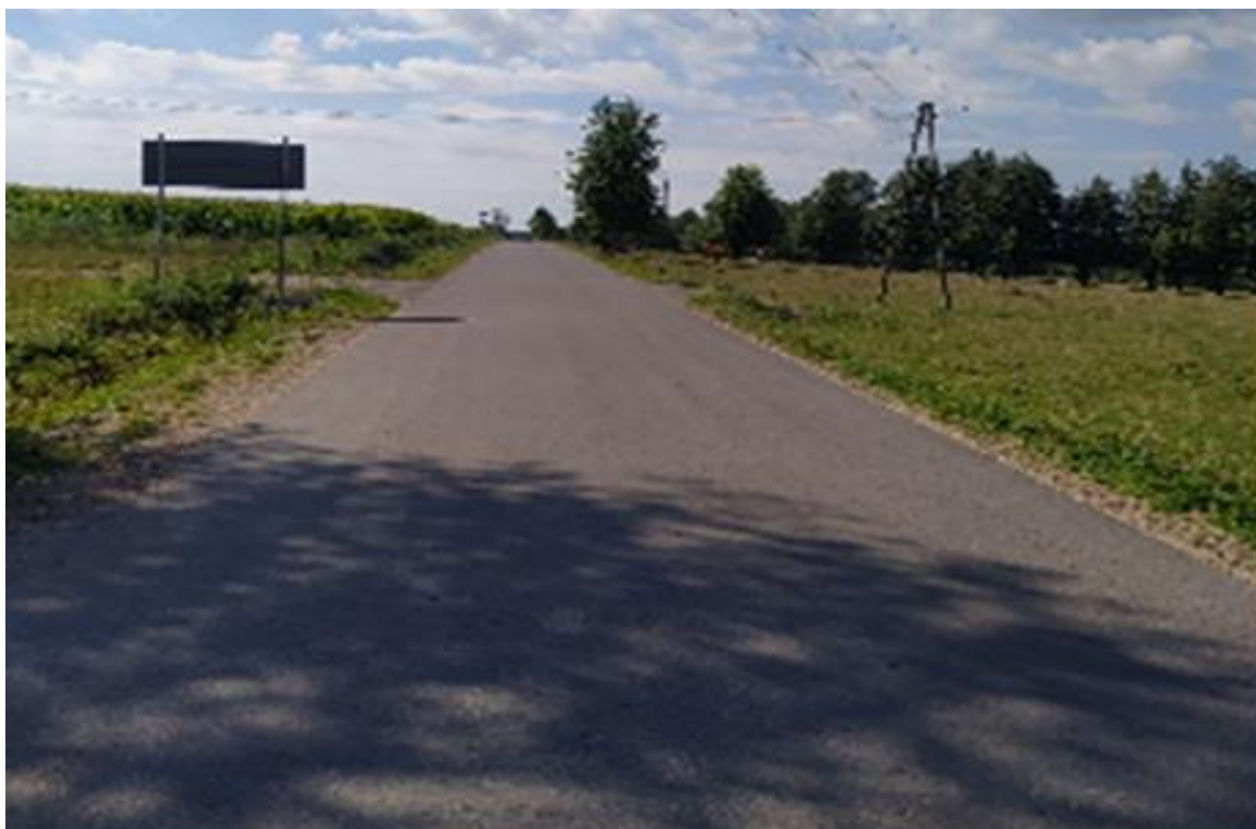
Zdjęcie 2. Droga gminna nr 104149B od drogi wojewódzkiej nr 668 do drogi powiatowej nr 1835B

Całkowity koszt zadania wyniósł 3 536 248,73 zł, z czego wartość otrzymanego dofinansowania to 3 359 436,29 zł