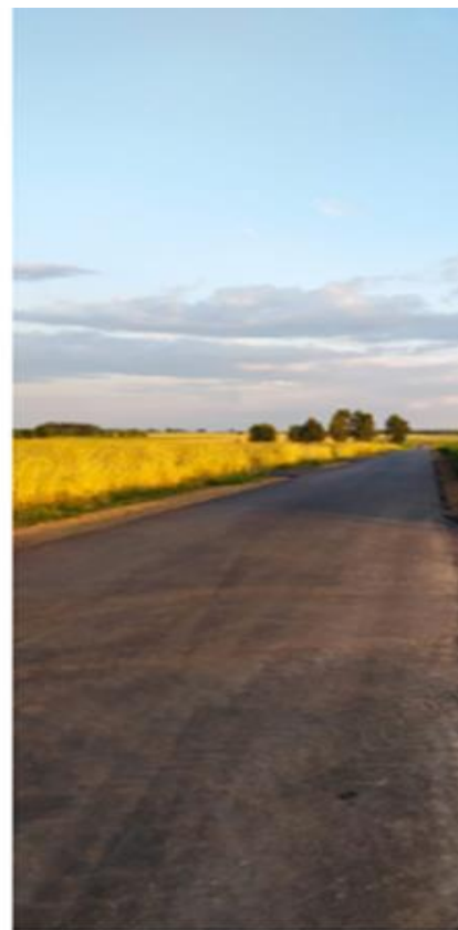
Zdjęcie 4. Droga gminna nr 162505B Klimaszewnica – Kieljany