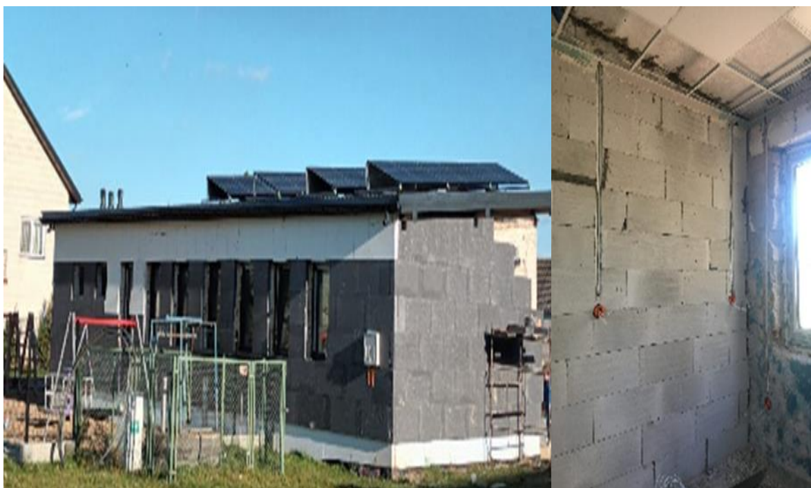
Zdjęcie 8. Świetlica w msc. Łoje - Awissa

Zadanie pn. „ Przebudowa budynku świetlicy wiejskiej w Łojach Awissa ” współfinansowano przy pomocy środków z budżetu Województwa Podlaskiego w ramach „Programu odnowy wsi województwa podlaskiego – Kreatywna wieś”.