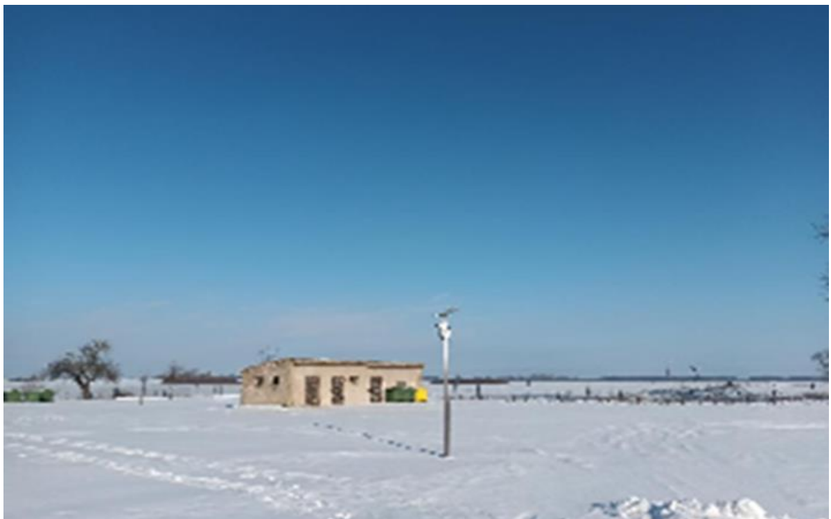
Zdjęcie 6. Monitoring terenu Szkoły Podstawowej w Słuczu