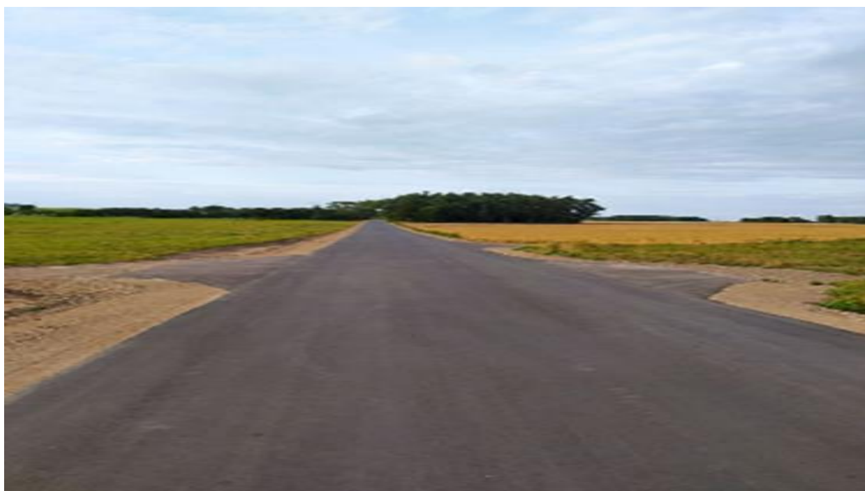
Zdjęcie 3. Droga gminna nr 104134B od drogi wojewódzkiej nr 668 w m. Karwowo do m. Świącienin

Całkowity koszt zadania wyniósł 4 266 824,74 zł, z czego wartość otrzymanego dofinansowania to 4 053 483,00 zł.