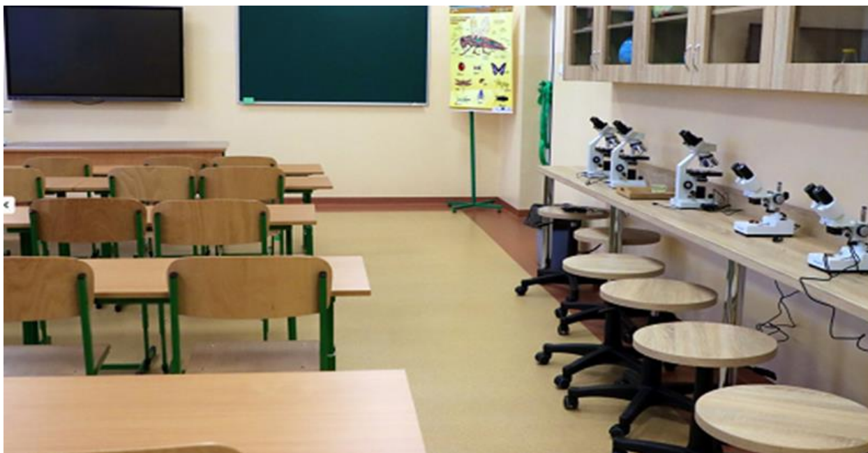
Zdjęcie 10. Ekopracownia w Zespole Szkolno – Przedszkolnym w Radziłowie.

Stworzenie ekopracowni przyrodniczej możliwe było dzięki dotacji w ramach Programu Regionalnego Wsparcia Edukacji Ekologicznej „Ekopracownia- zielone serce szkoły”. Dofinansowanie z Wojewódzkiego Funduszu Ochrony Środowiska i Gospodarki Wodnej wyniosło 47 870,27 zł, pozostałe środki pochodziły z budżetu Gminy Radziłów oraz Rady Rodziców.