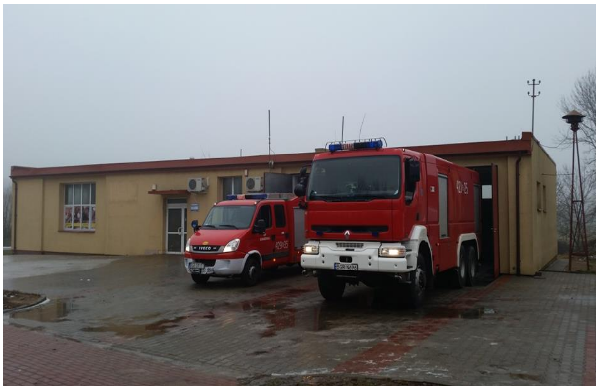
Zdjęcie 14. Samochody ratowniczo – gaśnicze OSP Klimaszewnica

Ochotnicza Straż Pożarna w Klimaszewnicy w 2023 roku została zadysponowana do 8 interwencji: