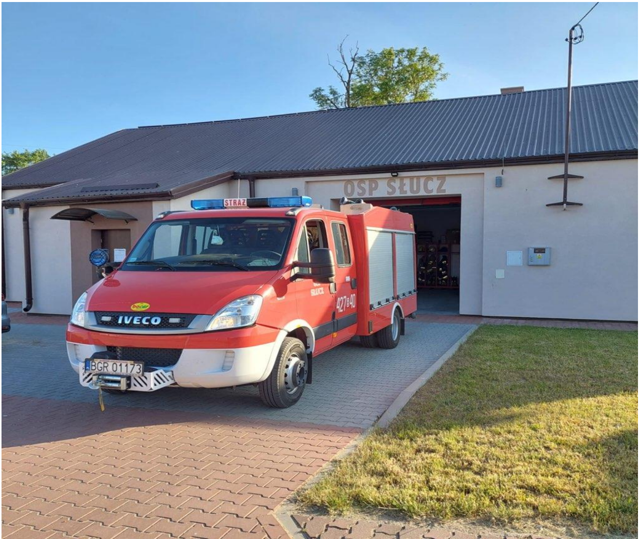
Zdjęcie 15. Strażnica OSP Słucz

Ochotnicza Straż Pożarna w Słuczu w 2023 roku została zadysponowana do 14 interwencji: