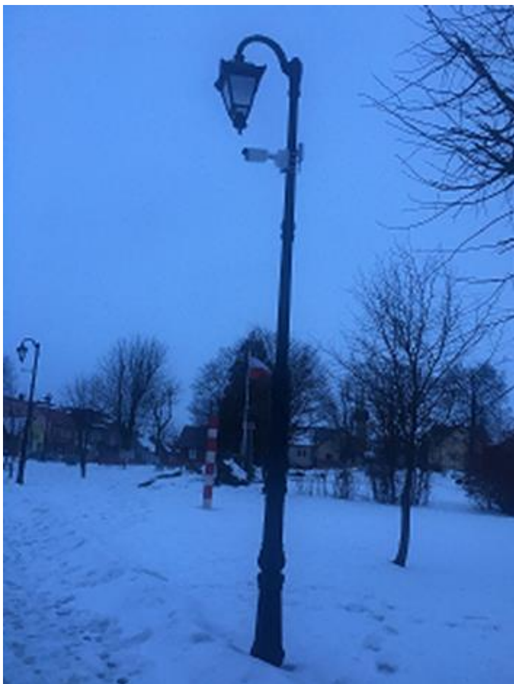
Zdjęcie 7. Monitoring w parku w Radziłowie