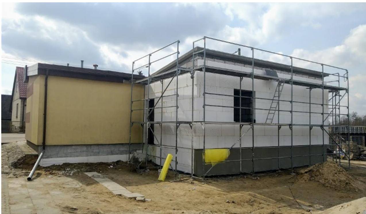
Zdjęcie 11. Świetlica w Karwowie