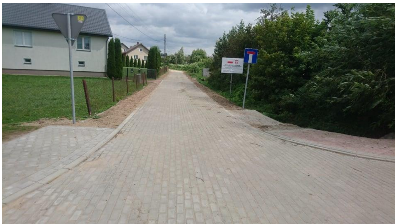
Zdjęcie 1. Droga gminna nr 162760B ulica Łomżyńska w msc. Radzilów.

Przebudowa drogi gminnej nr 162760B ulica Łomżyńska w msc. Radzilów – ogółem wartość zadania – 146 790,80 zł, dofinansowanie – 69 570, 70 zł, wkład własny – 77 220,10 zł.