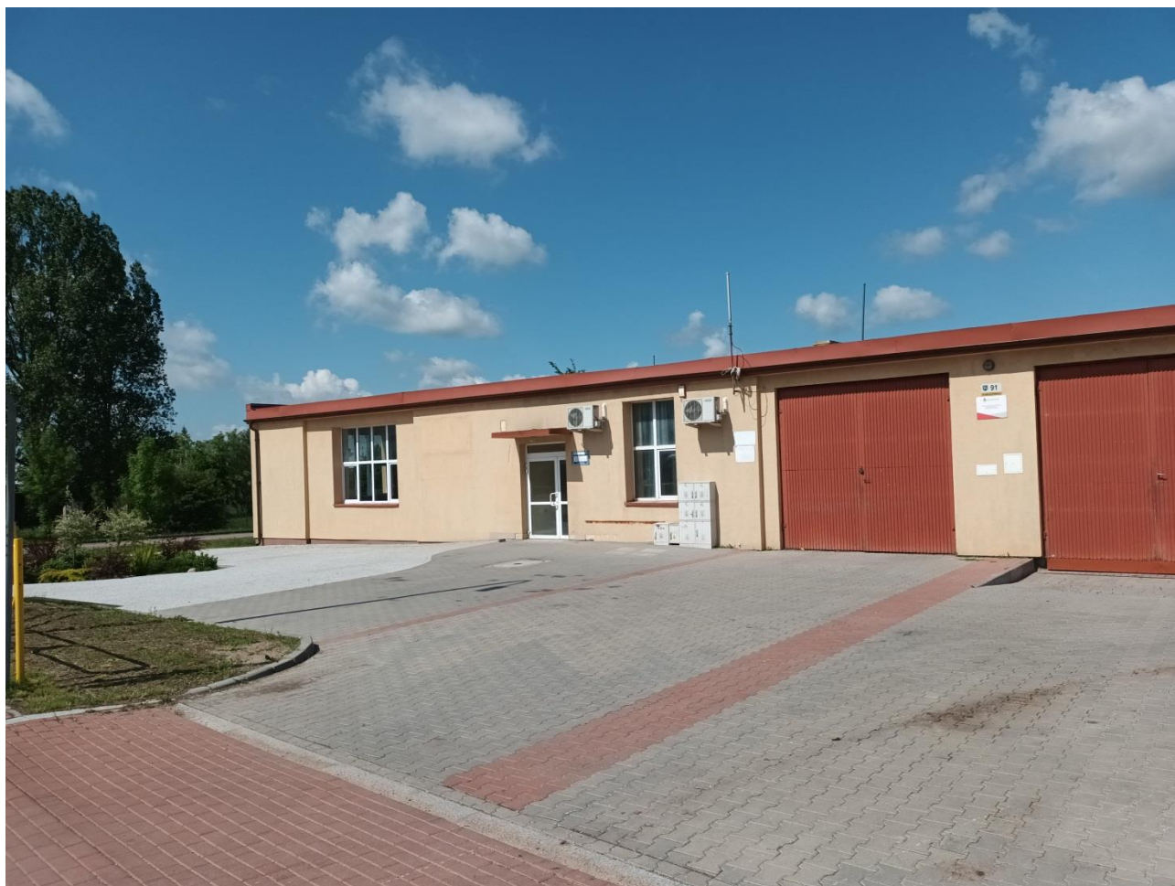
Zdjęcie 9. Zagospodarowanie terenu wokół budynku komunalnego w Klimaszewnicy

W ramach zadania pn. Zagospodarowanie terenu wokół budynku komunalnego w msc. Klimaszewnica wykonano prace budowlane polegające na ustawieniu krawężników 15x30x100 cm o długości 50 m oraz ułożeniu kostki betonowej na powierzchni 360 m 2 . Wartość inwestycji 16 420,50 zł w całości finansowana ze środków Gminy Radziłów.