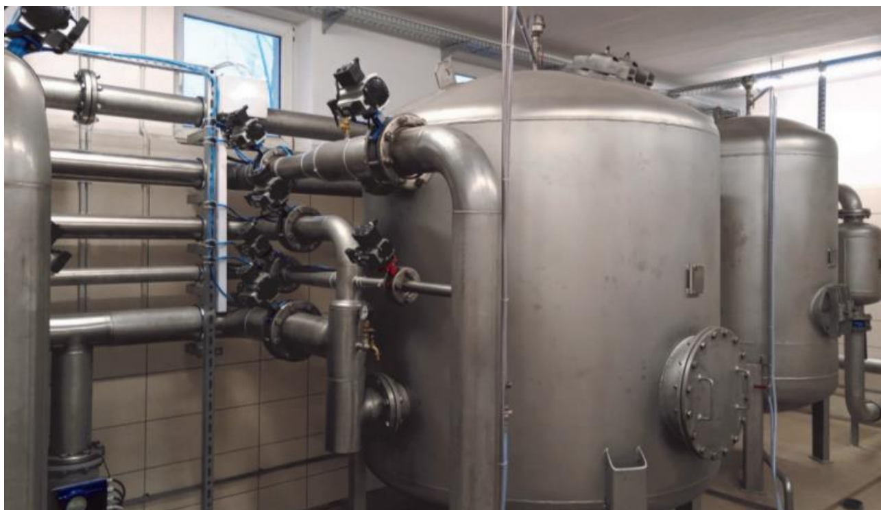
Zdjęcie 14. Stacja uzdatniania wody w msc. Słucz

Rozpoczęto realizację zadania pn. „Przebudowa stacji uzdatniania wody w msc. Słucz”. Zakres robót obejmuje przebudowę budynku stacji uzdatniania wody, budowę zbiorników wyrównawczych, wymianę obudów studni głębinowych, przebudowę osadnika popłuczyn, przebudowę istniejącej infrastruktury technologicznej oraz wykonanie utwardzonych dojazdów i dojazdów do obiektów. Całkowita wartość inwestycji wyniesie 2 253 464,39 zł. Środki w kwocie finansowe na realizację zadania pochodzą z Rządowego Funduszu Inwestycji Lokalnych.