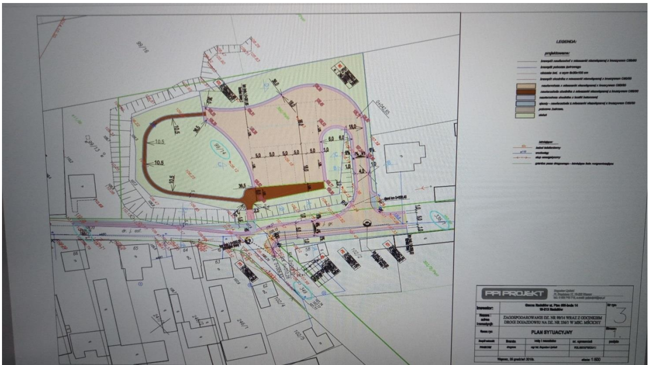
Zdjęcie 12. Projekt zagospodarowania terenu w Mścicach