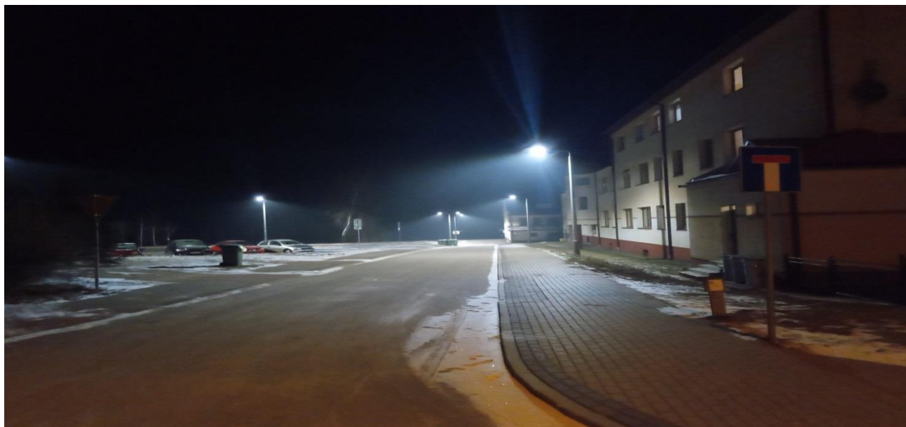
Zdjęcie 7. Oświetlenie terenu Szkoły Podstawowej w Radziłowie

Zakończony został pierwszy etap prac zadania pn. Wykonanie oświetlenia terenu Szkoły Podstawowej w Radziłowie , w ramach, którego wykonano okablowanie frontu szkoły oraz okablowanie oświetlenia dojścia do sali gimnastycznej, zamontowano również 6 szt. lamp. Wartość wykonanych robót wyniosła 102 692,54 zł. Rozpoczęte działania stanowią początek prac służących poprawie bezpieczeństwa osób przebywających na terenie Szkoły Podstawowej w Radziłowie.