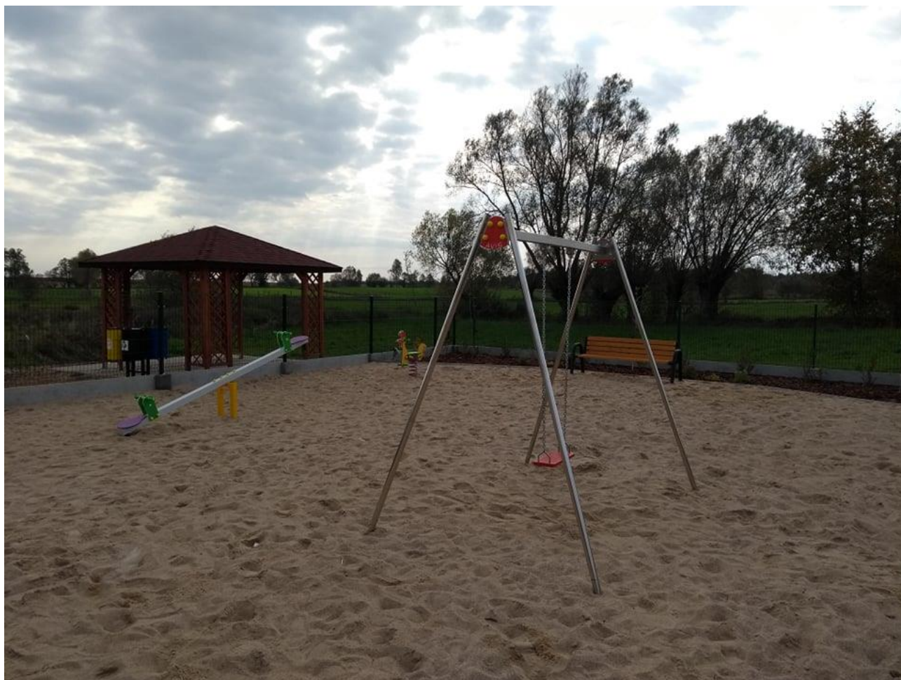
Zdjęcie 10. Teren przy budynku świetlicy wiejskiej w msc. Zakrzewo

huśtawkę ważkę, bujak sprężynowy. Zamontowano elementy małej architektury altankę, ławkę oraz kosz do segregacji odpadów stanowiący proekologiczne rozwiązanie przyczyniające się do wzrostu wiedzy ekologicznej wśród mieszkańców. W celu poprawy bezpieczeństwa zamontowano lampę led. Wartość wykonanych prac 31 701,39 zł, z czego 14 911,01 zł stanowi dofinansowanie. Zadanie pn. Zagospodarowanie terenu przy budynku świetlicy wiejskiej w miejscowości Zakrzewo współfinansowano przy pomocy środków z budżetu Województwa Podlaskiego w ramach „Programu odnowy wsi województwa podlaskiego – Kreatywna wieś”.