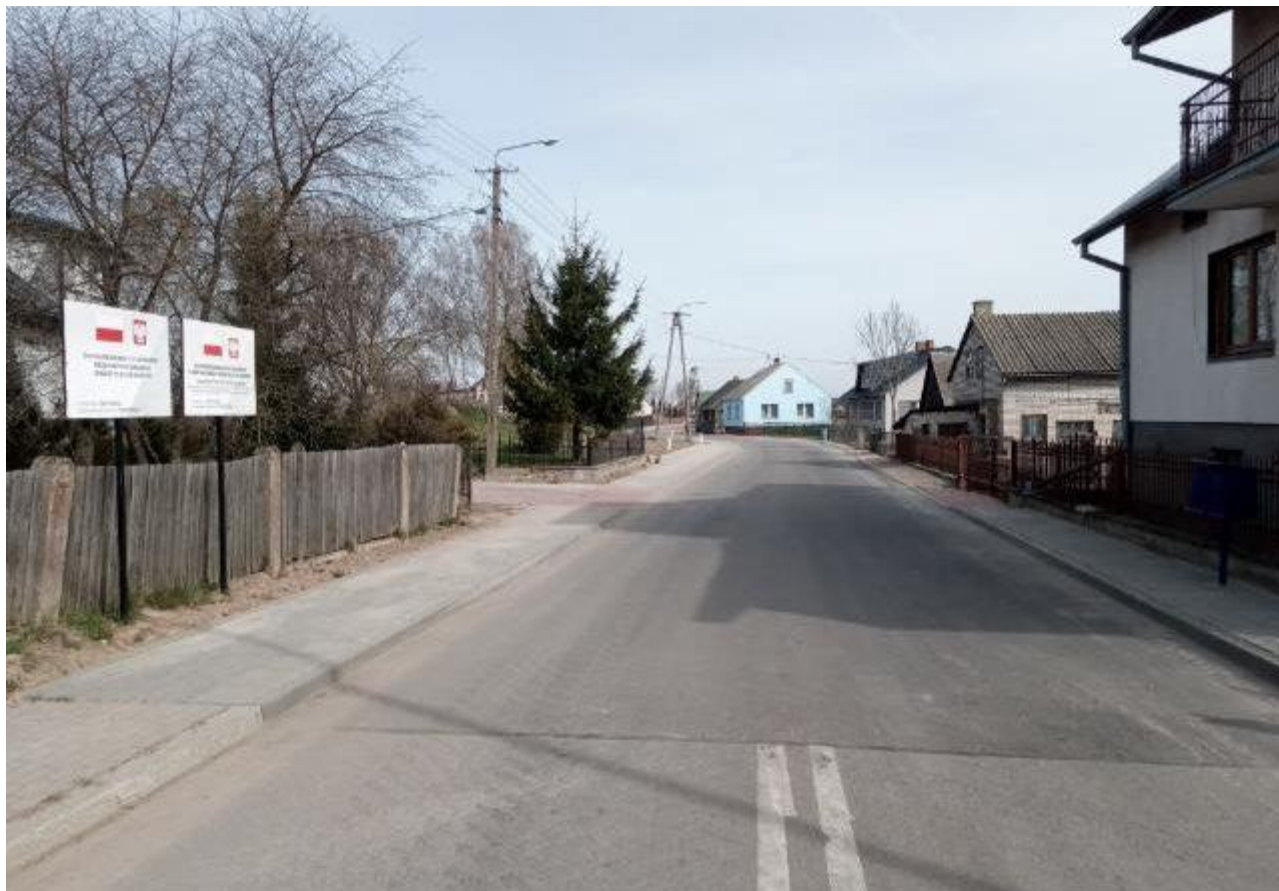
Zdjęcie 2. Drogi gminne nr 104158B, 162714B i 162717B w msc. Klimaszewnica

wyniósł 1 785 055,88 zł , z czego otrzymano dofinansowanie w kwocie 879 116,23 zł z Rządowego Funduszu Rozwoju Dróg oraz 546 180,00 zł z Rządowego Funduszu Inwestycji Lokalnych. Planowany termin zakończenia inwestycji 14 czerwca 2022 r.