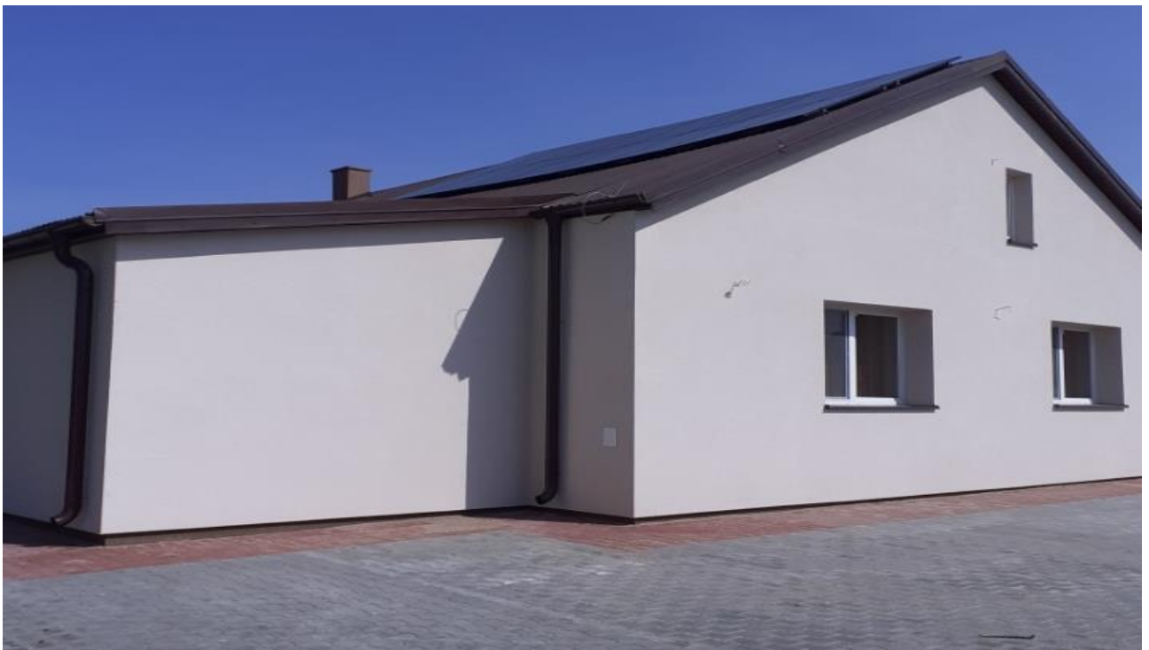
Zdjęcie 13. Świetlica w Słuczu

W 2021 r. kontynuowano prace remontowo - budowlane w ramach zadania pn. Przebudowa budynku świetlicy wiejskiej w msc. Słucz. Otrzymane wsparcia finansowane pozwoliło na zrealizowanie prac związanych z montażem paneli fotowoltaicznych o mocy 6 kW. Wartość wykonanych prac 35 670,00 zł.