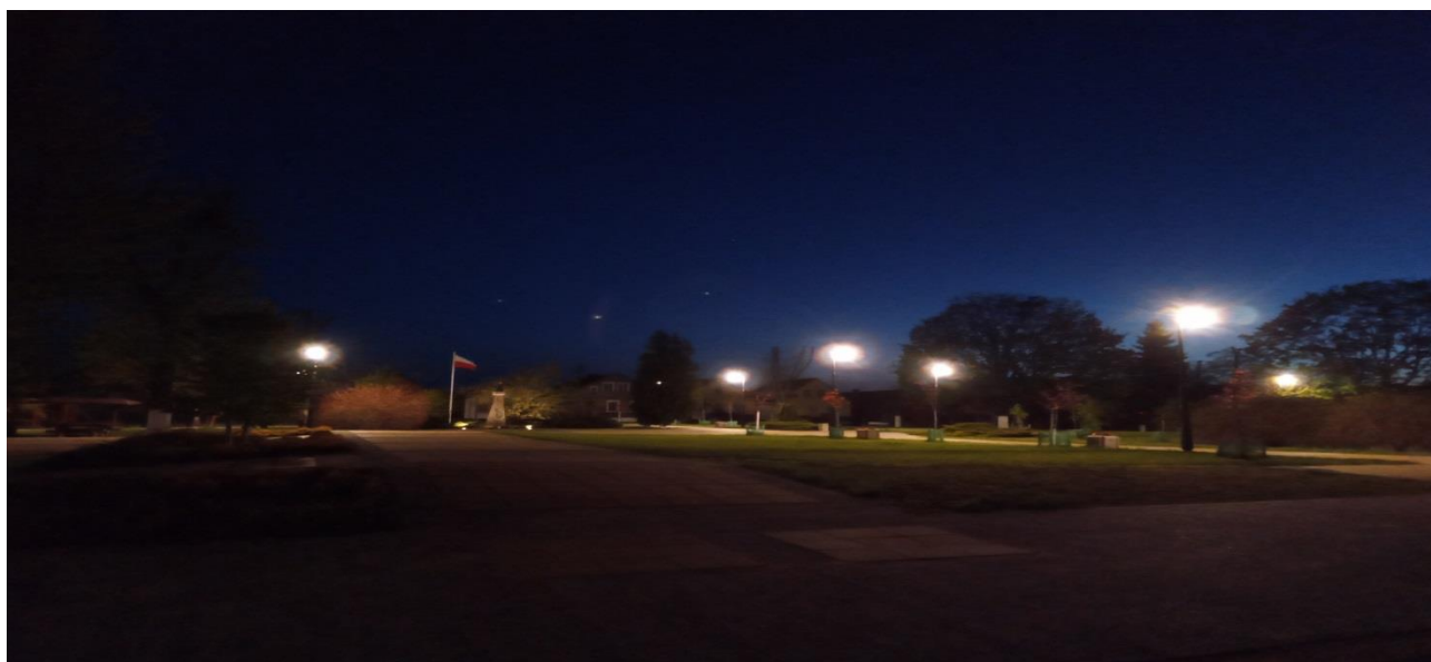
Zdjęcie 8. Oświetlenie parku w Radziłowie

W ramach zadania pn. Modernizacja parku w Radziłowie wykonano prace związane z oświetleniem parku. Zamontowano 11 szt. lamp oraz 2 kpl projektorów oświetleniowych. Prace zrealizowano ze środków własnych. Wartość wykonanych prac 39 184,36 zł, w całości finansowana ze środków Gminy Radziłów.