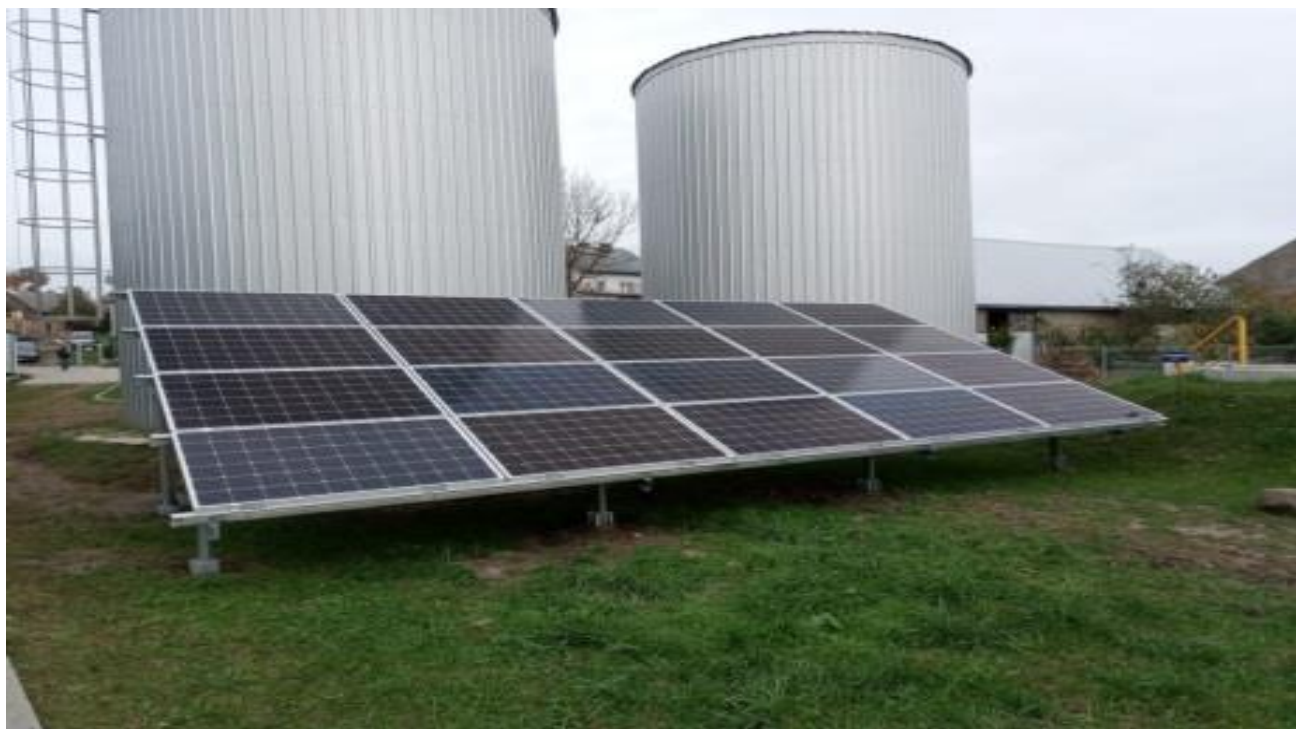
Zdjęcie 5. Instalacja fotowoltaiczna – Stacja uzdatniania wody w msc. Radziłów

Zamontowano 5 nowych instalacji fotowoltaicznych zlokalizowanych na budynkach użyteczności publicznej w Radziłowie (stacja uzdatniania wody), Łojach - Awissa (stacja uzdatniania wody oraz oczyszczalnia ścieków), Klimaszewnicy (oczyszczalnia ścieków), Mścichach (Dom Pomocy Społecznej). Łączna wartości 349 320,00 zł brutto.