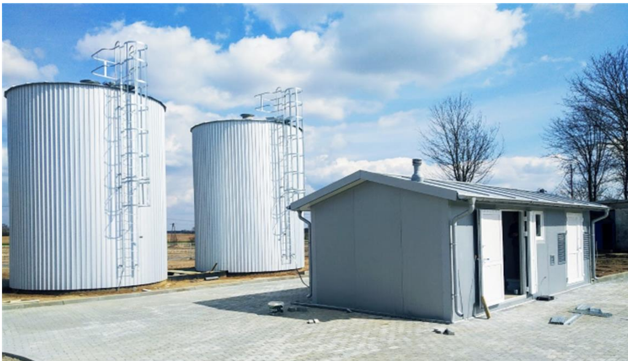
Zdjęcie 15. Pompownia wody wraz ze zbiornikami wyrównawczymi w msc. Święcienin