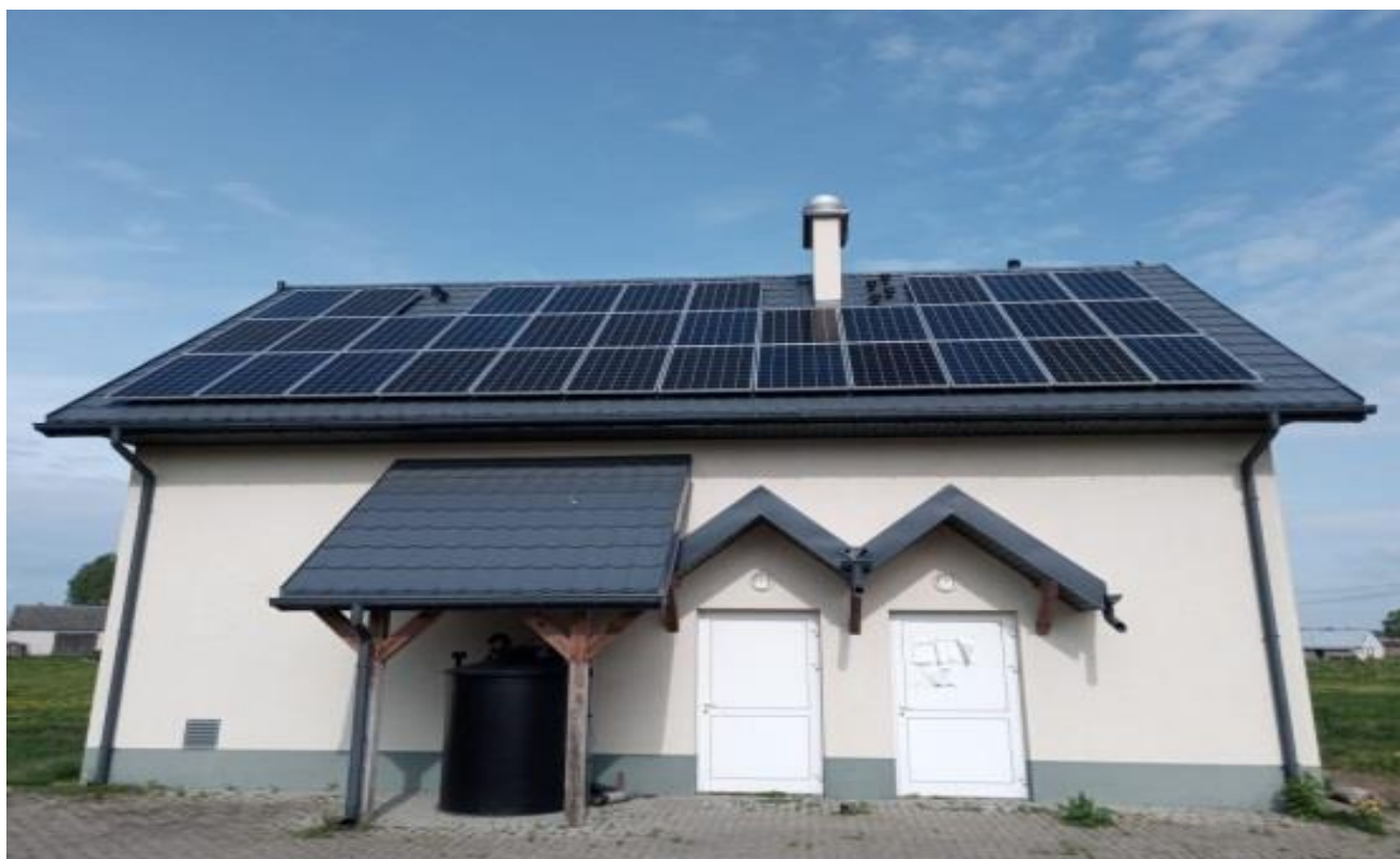
Zdjęcie 6. Instalacja fotowoltaiczna – oczyszczalnia ścieków w msc. Klimaszewnica