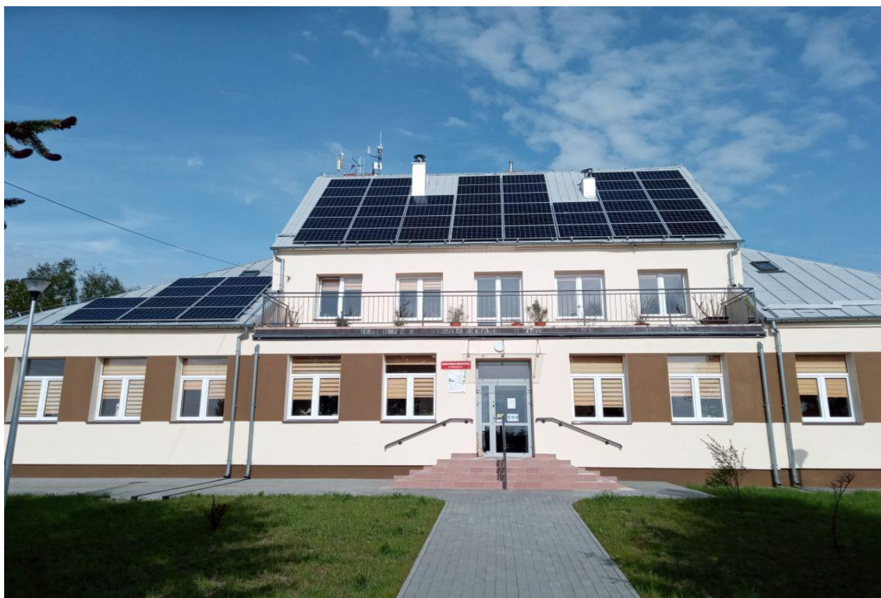
Zdjęcie 4. Instalacja fotowoltaiczna – Dom Pomocy Społecznej w Mścichach

Gmina Radziłów zrealizowała projekt pn. Budowa instalacji fotowoltaicznych na potrzeby własne obiektów gminnych w Gminie Radziłów współfinansowany ze środków Unii Europejskiej w ramach Regionalnego Programu Operacyjnego Województwa Podlaskiego na lata 2014 – 2020.