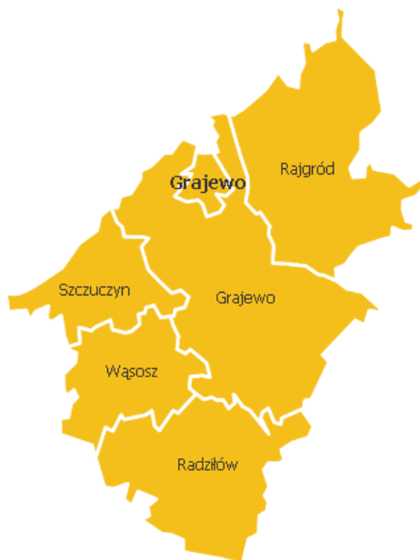
Ilustracja 1: Gmina Radziłów na tle powiatu